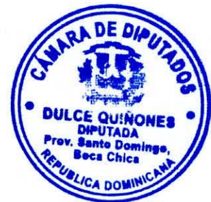
Dra. Dulce Mercedes Quiñones Diputada al Congreso Nacional